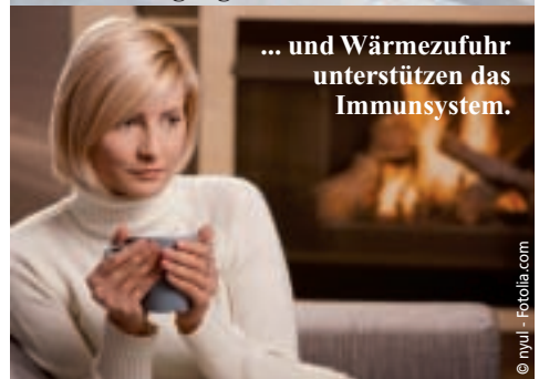
... und Wärmezufuhr unterstützen das Immunsystem.