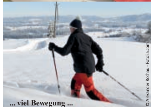
... viel Bewegung ...