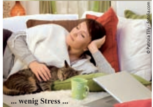
... wenig Stress ...