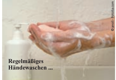
Regelmäßiges Händewaschen ...

Wichtig ist es auch, den Körper warm zu halten. Sind die Füße unterkühlt, reagiert der Organismus darauf mit einer Engstellung der Gefäße, um die verbliebene Wärme zu halten. Insgesamt wird dann aber der Körper schlechter durchblutet, auch die Nasen- und Rachenschleimhäute werden anfälliger für Viren.